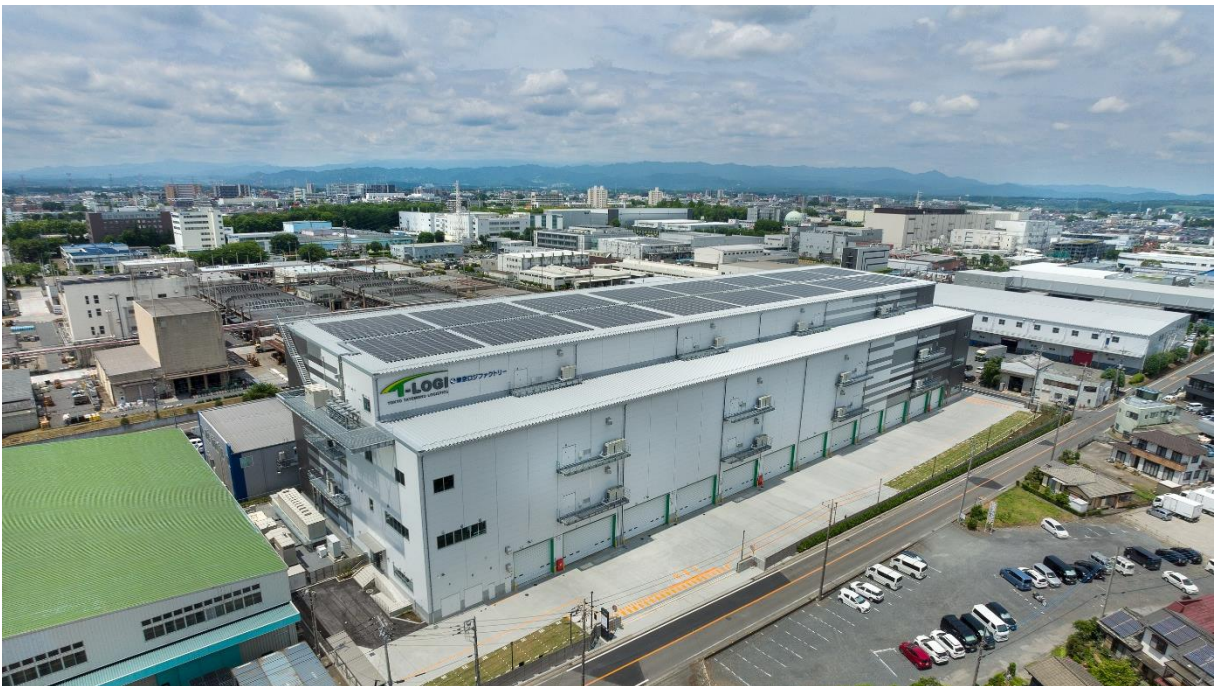
< 「T-LOGI 鶴ヶ島」 外観 >

本物件は、東京ロジファクトリー株式会社（本社：東京都立川市）が入居し、同社の鶴ヶ島「第2物流センター」として開業します。