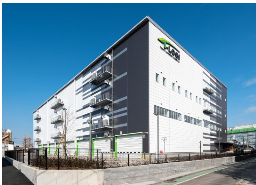
<T-LOGI横浜青葉 建物外観写真>

本物件は東名高速道路および第三京浜道路が利用可能かつ、人口集積地・産業集積地である横浜港北エリアに位置しており、物流施設としては希少な物件となります。横浜市営地下鉄グリーンライン「川和町」駅から徒歩圏内に位置しているため、雇用確保の面でも優れた立地となります。